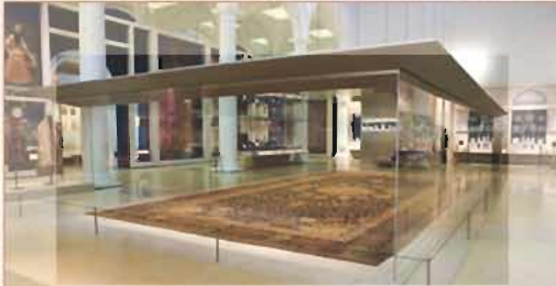
فرش شیخ‌صنی اردبیل یکی از پنج شاهکار جهان